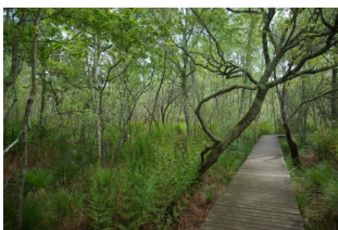
Vue station 4