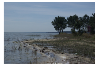
Vue station 7