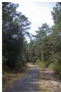
Piste cyclable en dune boisée